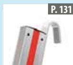
Travesía para tramos de escalera