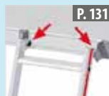
Juego de ganchos de suspensión