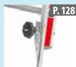
Juego de puntas de base para los largueros