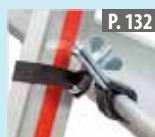
Juego de sujeción escalera en canalones