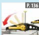
Juego de abrazadera escalera para bacas