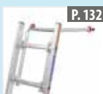
Distanciador de pared para escaleras de peldaños