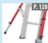
Juego de reequipamiento estabilizadores telescópicos y plegables